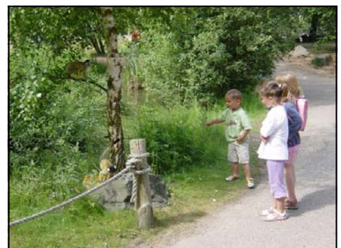
Foto: verwonderd kijken, vorig jaar in Beekse Bergen